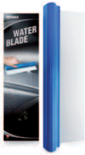
WATER BLADE Wasserwischer