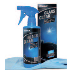
03061 1 Set | set | kit | set

Glass Clean produces a streak-free, brilliant shine on all glass surfaces. Removes stubborn dirt such as nicotine, insect residues, resin, grease and glue residues effortlessly and reliably.