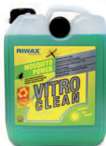
03166-1 5 l Karton à 4 Stück Carton à 4 pièces Cartone da 4 pezzi Pack of 4 pieces

Glass Polish cleans and polishes effortlessly and thoroughly in one operation. It removes all types of dirt without leaving smears or scratches. In addition, the glass is sealed to help the windscreen wipers glide more smoothly. The product contains ultramodern ingredients and is free from solvents and aggressive substances.