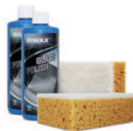
03345-Set 1 Set | set | kit | set

Ready-to-use cleaner for the wind screen washer system in the summer. Cleans and removes silicones, oil, fat and insect leftovers.