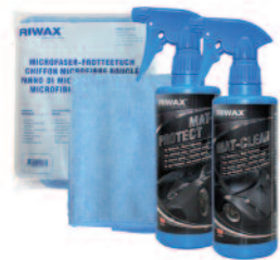
03013-SET 1 Set | set | kit | set

Reliably impregnates and protects fabric seats, carpets, awnings, soft-tops and sun awnings. Makes textiles of all kinds water and dirt-repellent.