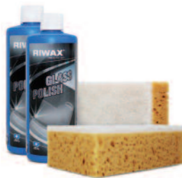
03345-Set 1 Set | set | kit | set

Glass Polish pulisce e lucida in una sola passata, toglie agevolmente e in profondità tutti i tipi di sporco senza lasciare striature o graffi. Inoltre sigilla il cristallo per garantire una migliore scorrevolezza delle spazzole del tergicristallo. Il prodotto è composto dalle materie prime più moderne e non contiene solventi o sostanze aggressive.