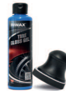
03006-SET 1 Set | set | kit | set

Cleans and preserves surfaces in one go. Boat Cleaner is a wax-based cleaning polish for use in removing stubborn dirt and eliminating oxidised and weathered top layers. Provides surfaces with fresh gloss and long-term protection.