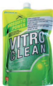
03162-2 2 l Karton à 6 Stück Carton à 6 pièces Cartone da 6 pezzi Pack of 6 pieces