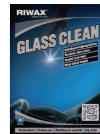
03500-1 Karton à 200 Stück Carton à 200 pièces Cartone da 200 pezzi Pack of 200 pieces

Contenuto del kit: 1 Glass Clean 500ml 1 panno in microfibra morbido