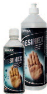
DESINEX GEL Desinfektionsmittel

Shiny Hands is a mild hand soap developed especially for mechanics, varnishers and painters. This gel-type soap with a refreshingly pleasant scent acts fast and reliably to remove stubborn contaminants such as two-component paints, varnishes, resin, adhesives and silicones, as well as unpleasant odours. The rehydrating skin peel prevents chapped, dried out hands.